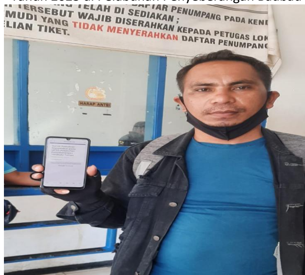
Gambar 2 Penumpang menunjukkan telah mengisi kuisisioner pada Google Form Dishub Tahun 2023 di Pelabuhan Penyeberangan

Berdasarkan hasil pengumpulan data, jumlah responden penerima layanan yang diperoleh yaitu 384 orang responden dari beberapa UPTD yang dipilih untuk dilakukan kegiatan SKM, dengan rincian sebagai berikut :