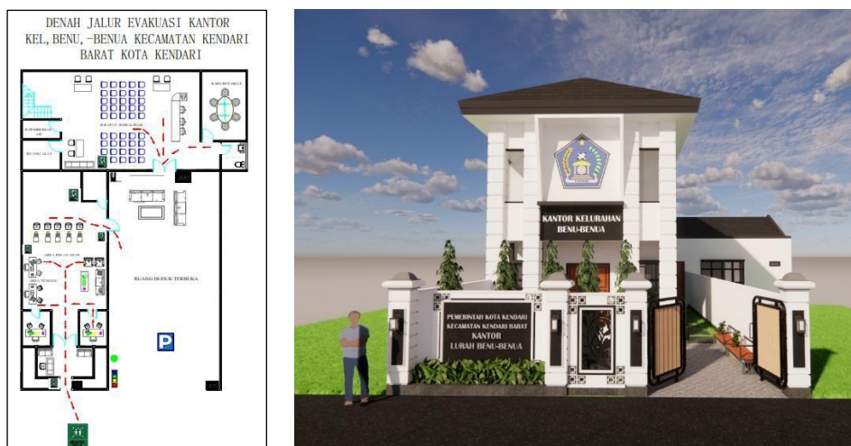
Gambar 2. Rancangan Denah & Tampak Depan Kantor Lurah Benu-Benua

Kelompok dosen Tim Pengabdian Prodi Teknik Sipil dalam kegiatan ini juga menghasilkan beberapa rancangan infrastruktur seperti rancangan desain Kantor Lurah Benu-benua, rancangan pagar dan ruang parkir, drainase dll.