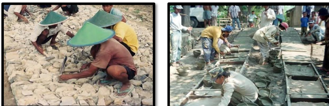
Gambar 5. Konstruksi Jalan Telford & Rabat Beton

Kemiringan melintang permukaan jalan atau cross slope adalah bagian dari desain geometrik jalan yang sangat penting untuk memastikan keselamatan dan kenyamanan pengguna jalan. Fungsi utama dari kemiringan melintang permukaan jalan adalah membantu air hujan mengalir ke bahu jalan atau selokan dengan cepat, sehingga mencegah terjadinya genangan air di permukaan jalan. Genangan air dapat menyebabkan kondisi jalan licin dan berisiko tinggi bagi pengguna jalan [5]. Kemiringan melintang yang efektif membantu mencegah akumulasi air di permukaan jalan, yang dapat meresap ke dalam struktur jalan dan menyebabkan kerusakan seperti lubang atau retakan.