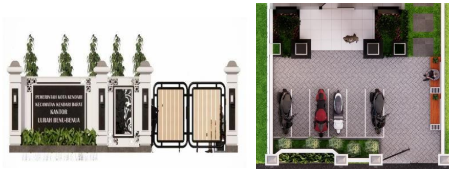
Gambar 3. Rancangan Pagar & Ruang Parkir Kantor Lurah Benu-Benu