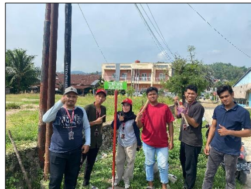
Gambar 6. Kegiatan Kunjungan Lapangan